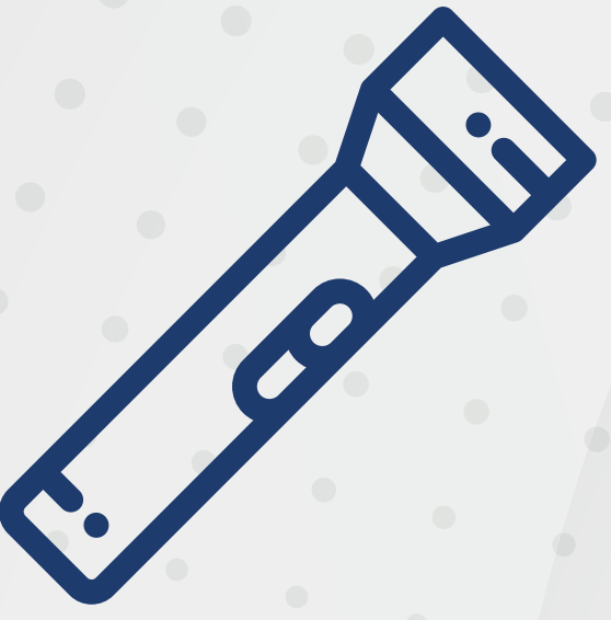
لمبة أو مصباح ضوئي