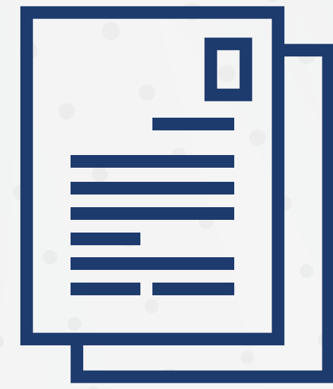
الأوراق ذات أهمية