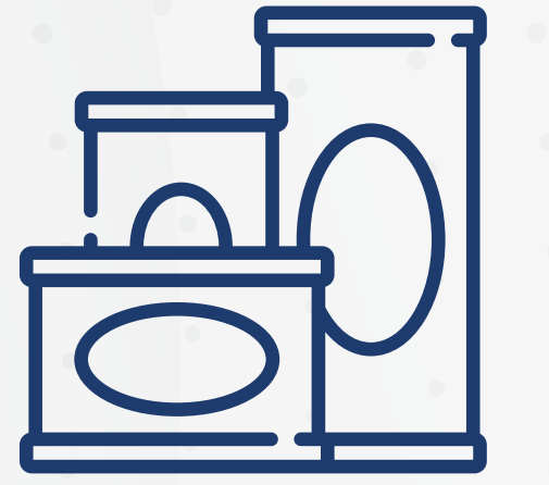
أطعمة غير قابلة للفساد كافية لثلاثة أيام