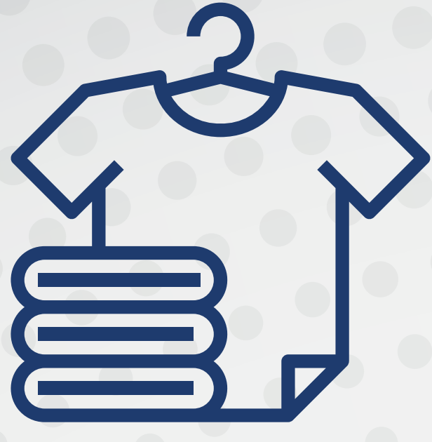
ملابس موسمية نظيفة

حقيبة الطوارئ المحتوية على معدات الطوارئ وأوراقك الخاصة المهمة تمنحك فرصة الحفاظ على سلامتك وسلامة أسرتك إلى حين وصول فريق الإنقاذ إليك بعد الكارثة.