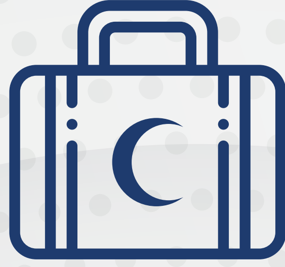
حقيبة الإسعاف الأولية