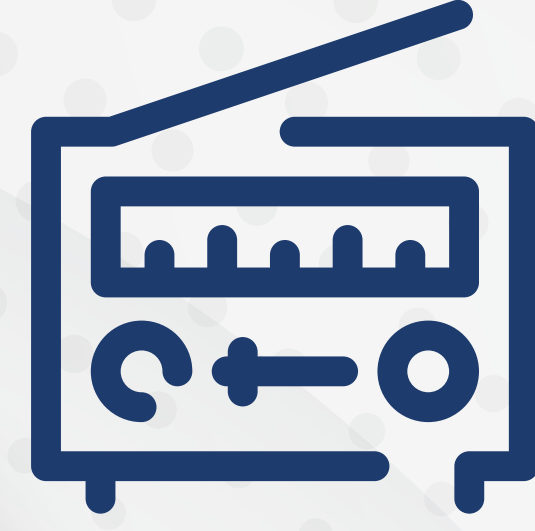
المذياع - جهاز راديو