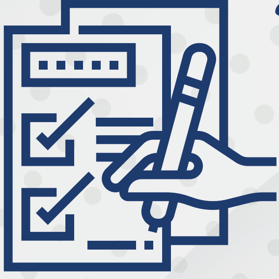
خطة الكوارث للأسرة